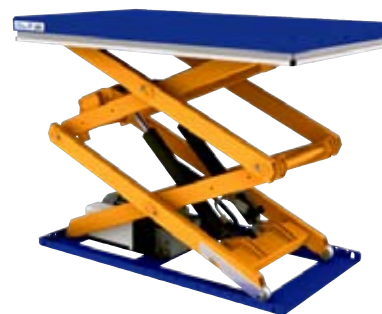
Der neue TLD 1000 mit zwei Zylindern.

Ferner wird der UC 60 im Laufe des Jahres 2010 eingeführt. Dies bedeutet Wertschöpfung für unsere Produktpalette.